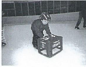
最後にビールケースを押したい 乗ったりして遊びます