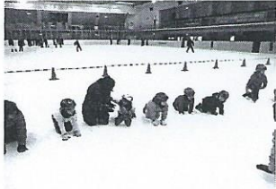
ハイハイから教えてもらいます

※スケートは安全で楽しいスポーツというのを教えたいので、保護者の方々、子どもが行きたくないのに無理して頑張らせないようにしてください。