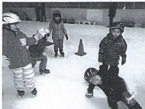
帰るころにお滑れる? 分かるようになります。