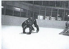
立つ練習のあと歩く練習